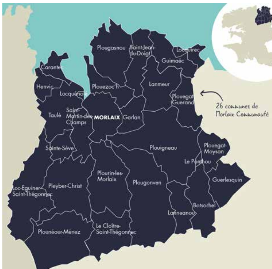
Carte de Morlaix Communauté

L'École Intercommunale de Musique, de Danse et d'Arts plastiques du Pays de Morlaix, association créée le 15 novembre 1973, a pour mission de transmettre à un public le plus large possible, sur une Communauté de Communes composée de 26 communes, une formation artistique et culturelle lui permettant d'appréhender la diversité et la richesse des expressions artistiques. À ce titre, elle assure aujourd'hui une véritable mission de service public.