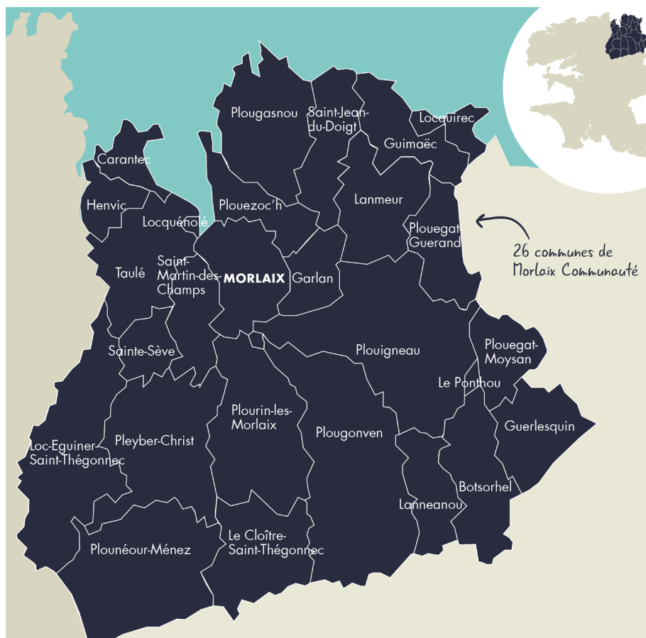
Carte de Morlaix Communauté

L'École Intercommunale de Musique, de Danse et d'Arts plastiques du Pays de Morlaix, association créée le 15 novembre 1973, a pour mission de transmettre à un public le plus large possible, sur une Communauté de Communes composée de 26 communes, une formation artistique et culturelle lui permettant d'appréhender la diversité et la richesse des expressions artistiques. À ce titre, elle assure aujourd'hui une véritable mission de service public.